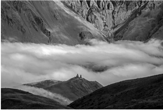
გერგეტის სამება. შალვა ლეჟავას ფოტო.